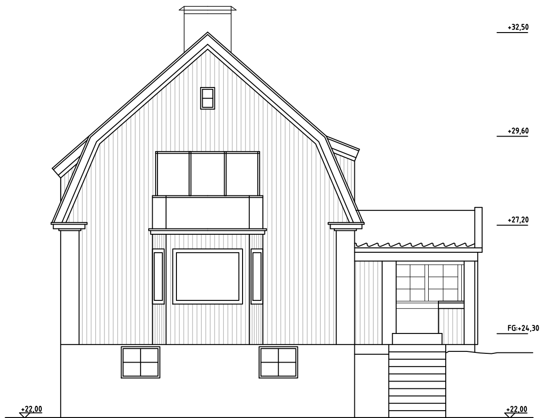
FASAD MOT SYDVÄST / KUTTERGATAN